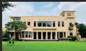
東京都庭園美術館