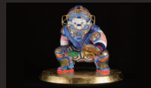
中村弘峰 / 福岡