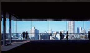
サントリー美術館