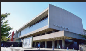
東京国立近代美術館